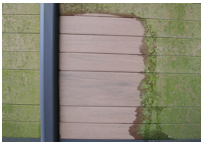
10. ... die Schönheit des Zaunes ist wieder sichtbar.