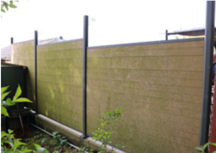
1. Nach Jahren sind die Pfosten und die Zaunfelder mit Grünalgen verschmutzt.