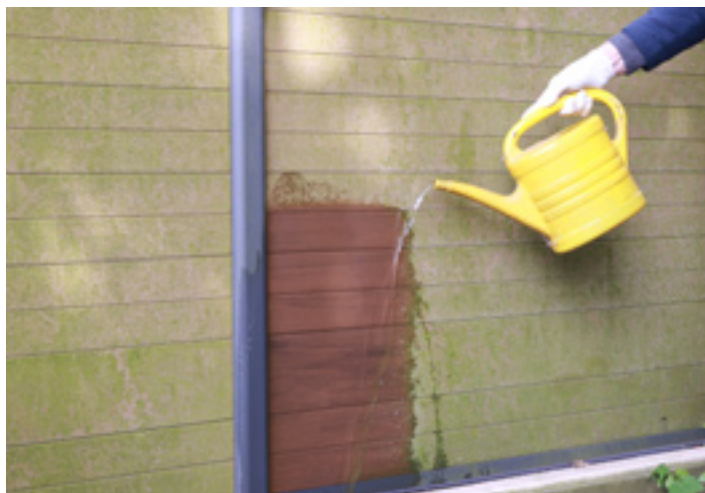
7. Zum Abspülen klares Wasser aus der Gießkanne ...