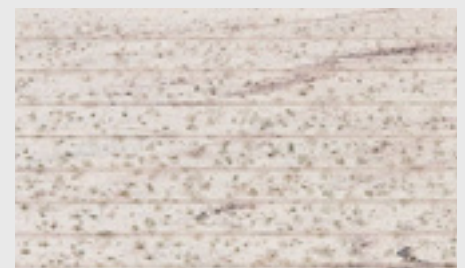
Stockflecken/Schimmel auf der Oberfläche

Kleine dunkelschwarze, oberflächliche Stockflecken auf den WPC-Elementen lassen sich im Außenbereich nicht immer vermeiden.