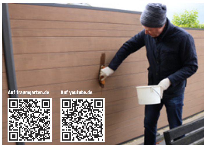
Zum Nachlesen oder Archivieren: Unsere Reinigungsvideos (Materialkunde zu WPC) wahlweise auf unserer Webseite oder youtube.