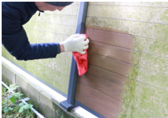
8. ... und zum schnelleren Abtrocknungsprozess das Tuch verwenden.