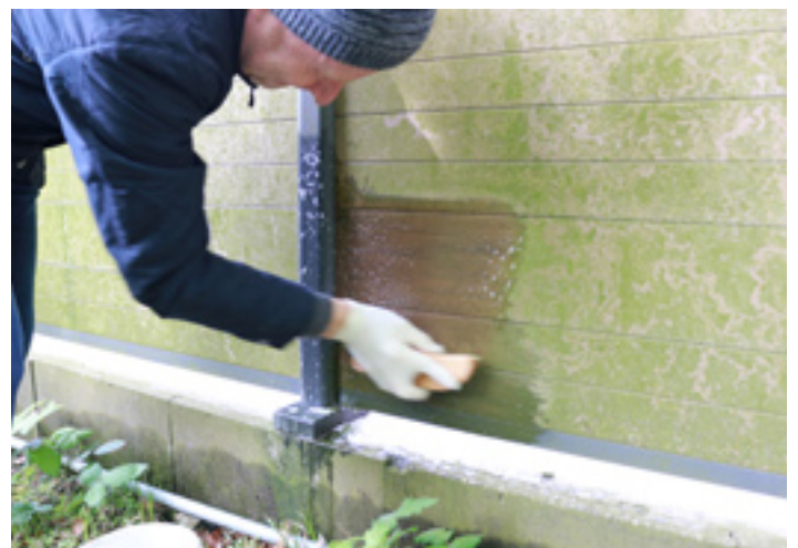
6. Mitunter so lange die Reinigung fortsetzen, bis das gewünschte Ergebnis erreicht wird.