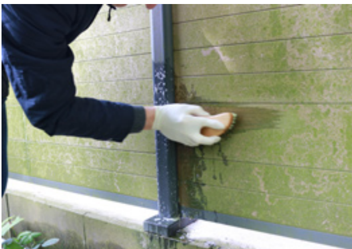
5. Bei der Reinigung immer in Faserrichtung bürsten!