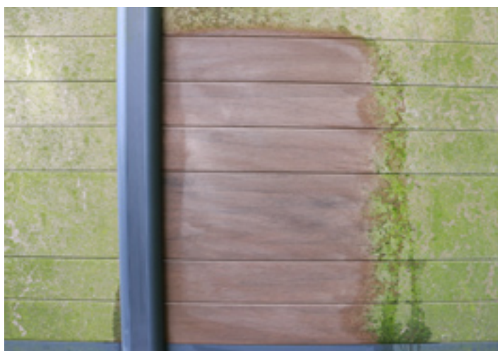
9. Die Trocknung beginnt und ...