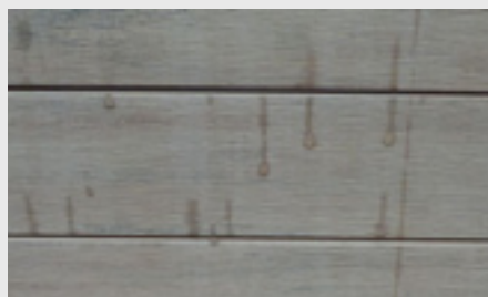
Fleckenbildung durch von Regen angelöste Partikel

Wichtig: Verwenden Sie keine lösemittel- oder kreidehaltigen Reiniger, da diese mitunter in die Oberfläche eindringen und die Gefahr der Verfärbung besteht. Laub und Früchte von Bäumen und Sträuchern können auf WPC Elementen ein natürlicher Nährstoff für Sporen sein. Außerdem führen pflanzliche Inhaltsstoffe, z.B. Gerbsäuren, aber auch lang anhaftender Vogelkot zu dauerhaften Verfärbungen auf der Oberfläche.