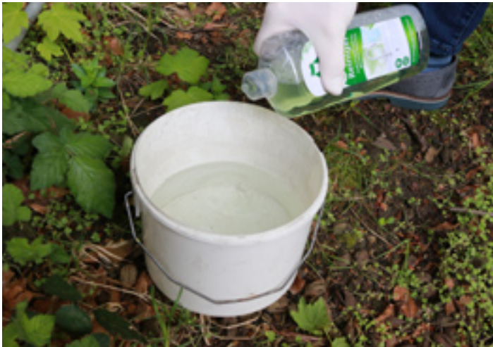
3. Den Essigreiniger nach Angaben des Herstellers dosieren.