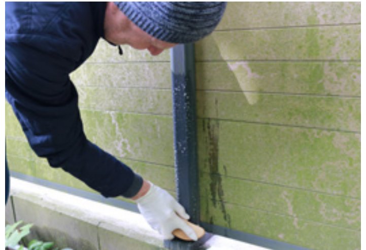
4. Die zu behandelnden Stellen mit der Wurzelbürste bearbeiten.