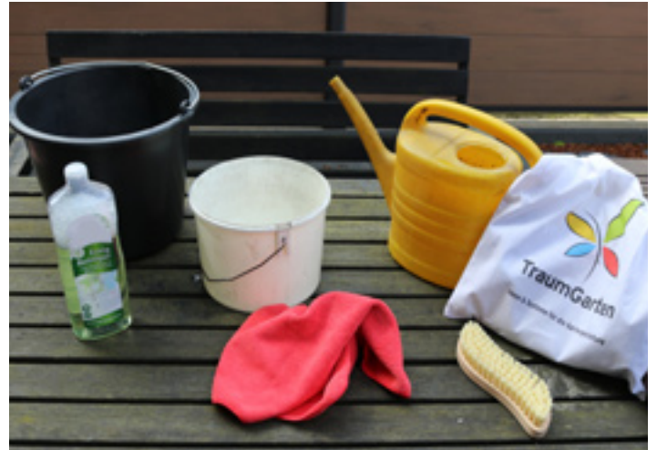
2. Zur Reinigung warmes Wasser, Essigreiniger, Wurzelbürste. Zum Abspülen Wasser und Gießkanne, ggf. Handschuhe, Schutzbrille. Optional Tuch.